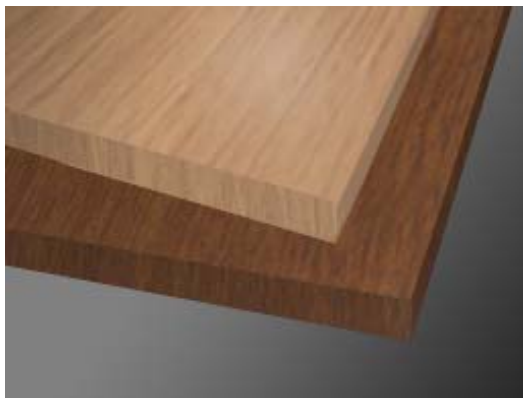
『吸音パネル サウンドマイルド 製品イメージ』

会議室やオフィス空間において吸音が考慮されず、非常にコミュニケーションが取りづらいケースが多々あります。このような状況を改善したいという声が多く聞かれます。『吸音パネル サウンドマイルド』は、耳障りな周波数の音を減衰させ、相手の声が聞き取りやすい環境をつくれます。こちらの声も相手に伝わりやすいので、テレビ・電話会議がスムーズに進行でき、スライディングウォールなどで、間仕切りされた広いオフィスや宴会場でも、マイクの響きを抑えて音声を通りやすくなります。